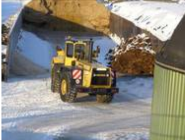
Radlader mit Wiegesystem und anschließender Auswertung mit Bio-Soft EEG09