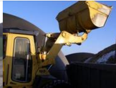
Fütterung mit Bio-Soft EEG09